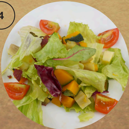
カボチャとサツマ芋のサラダ