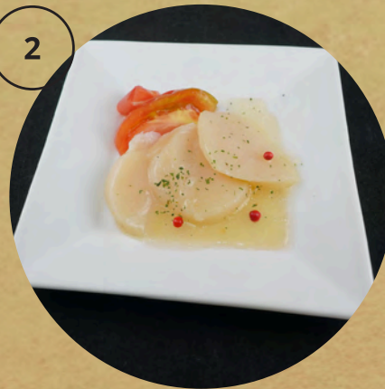
ホタテのカルパッチョ