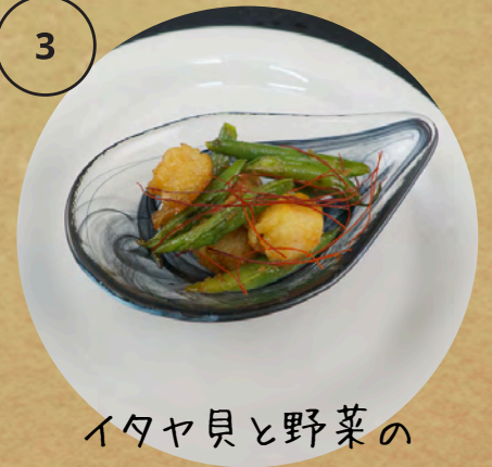
イタヤ貝と野菜の ガーリック炒め