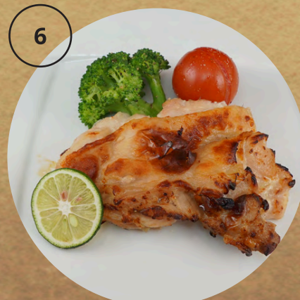
鶏肉の塩麹漬け焼き