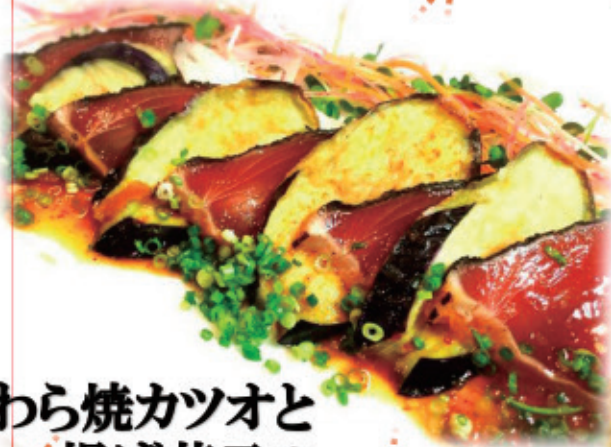
わら焼カツオと 揚げ茄子の 柚子ポン酢 ¥750