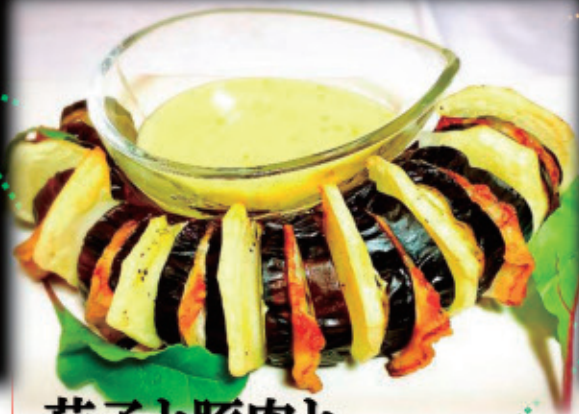
茄子と豚肉と ダンシャクの挟み焼き ～柚子胡椒の 3種チーズソース～ ¥900