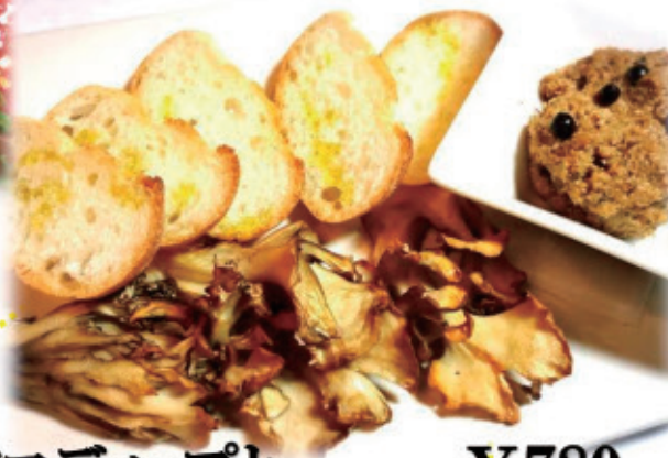
キノコディップと 厚沢部産焼き舞茸 ¥780