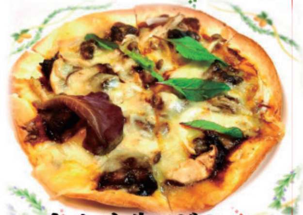
キノコと牛スジの ブラウンソースピザ ¥1,050