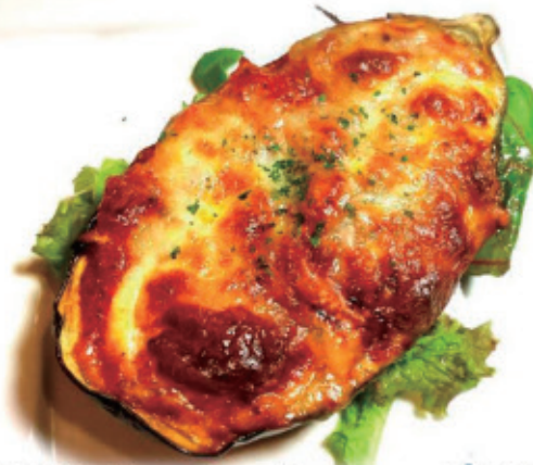
米茄子のミートソース焼き ¥800