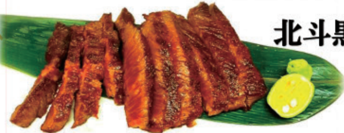
北斗黒毛和牛のステーキ ～和風仕立て～ ¥2,700