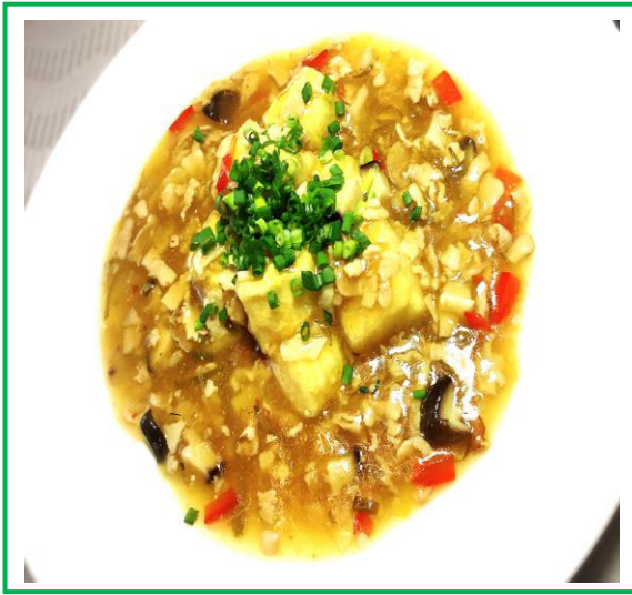
和風麻婆豆腐 ¥ 7 8 0