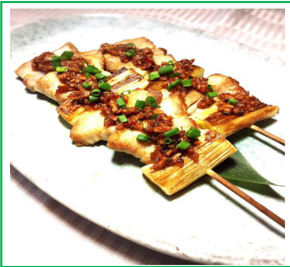
八雲豚のピリ辛串焼き ¥ 5 5 0