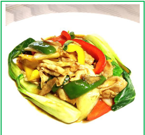
八雲豚のオイスター炒め ¥ 8 5 0