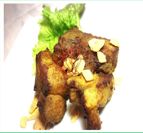
ポークスペアリヴのカレー風味 ¥ 9 3 0