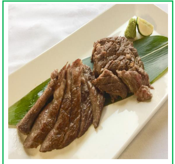
北海道北斗市産 北斗黒毛和牛ステーキ~和風仕立て~ ¥ 2700

温まる料理 & おつまみ 新年も北海道産を使用した オススメ7品となっております!!