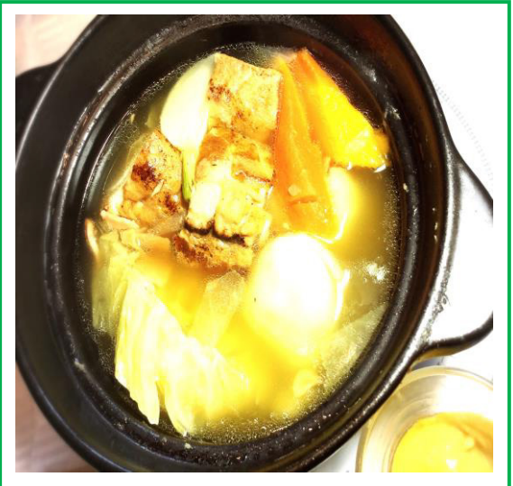
八雲産豚バラ肉の和風ポトフ ¥ 8 0 0