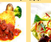
ポークヒレカツのミラノ風