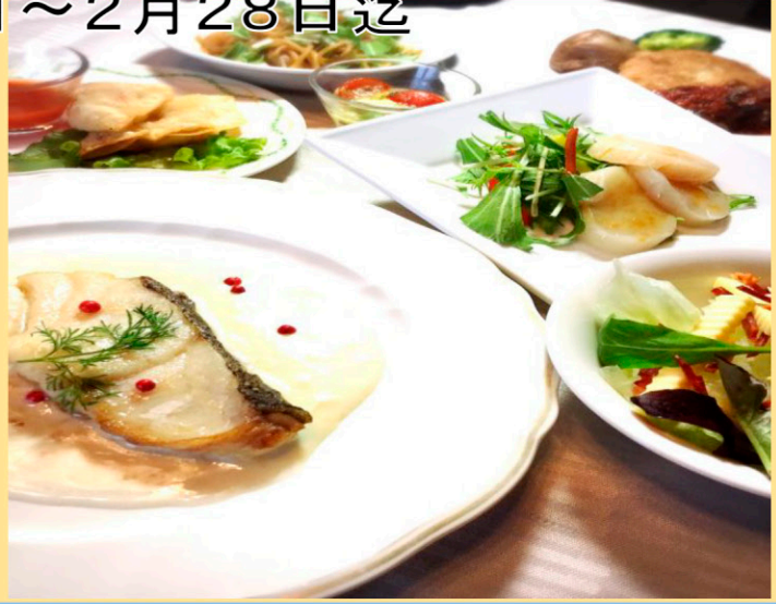
テージーコース 1名様 ¥3780