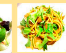
イサコイソリチーズのサラダ