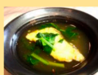
真鱈の唐揚げ かんずり風味唐揚げ