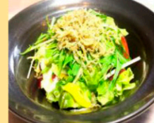
しらすと水菜のサラダ