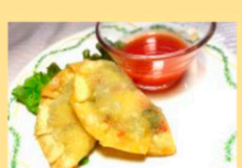
ポテサラ揚げギョーザ