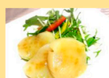
帆立貝のカルパッチョ バター風味