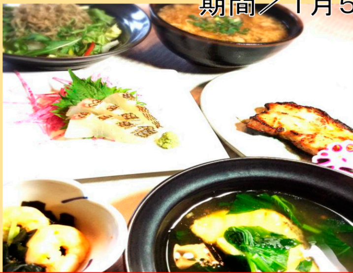
紫陽花コース 1名様 ¥3240