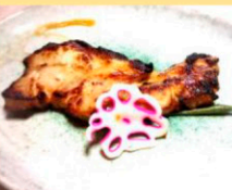
八雲産豚ロースの西京焼き