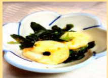
海老とワカメの土佐酢和え