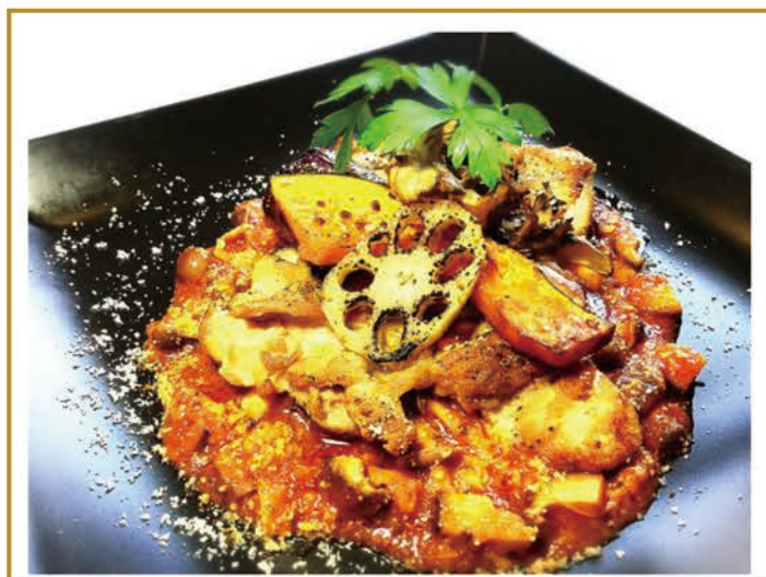
秋野菜と鶏肉のグリル きのこソース ¥900