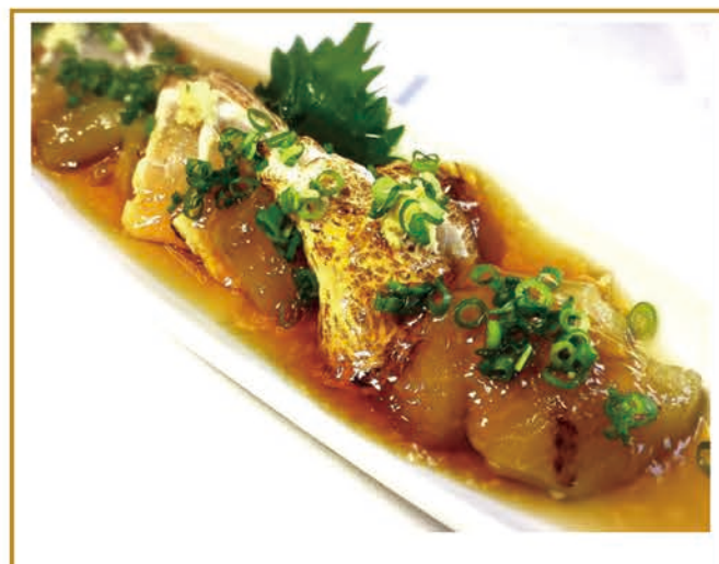
焼き茄子と炙りササミの 生姜ジュレ ¥680