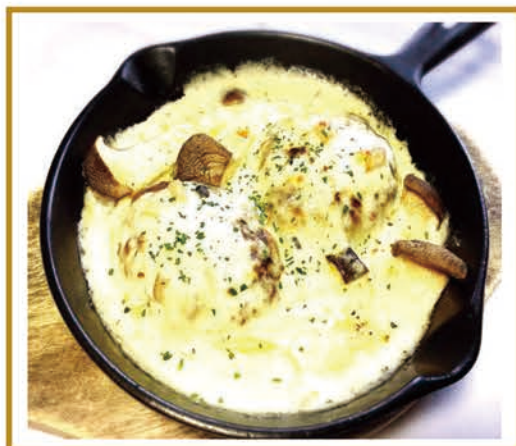
ハンバーグときのこのクリーム煮 ¥1100