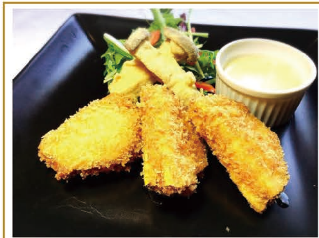
さつまいもとスモークチーズのフライ エリンギフリット添え ¥650