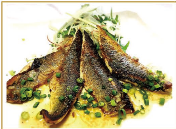
秋刀魚のロースト 柚子胡椒ソース ¥700