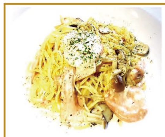
秋鮭スモークサーモンと きのこのこのパスタ ¥1150