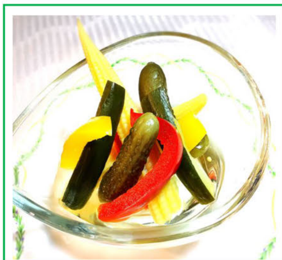
自家製ピクルス盛り ¥450