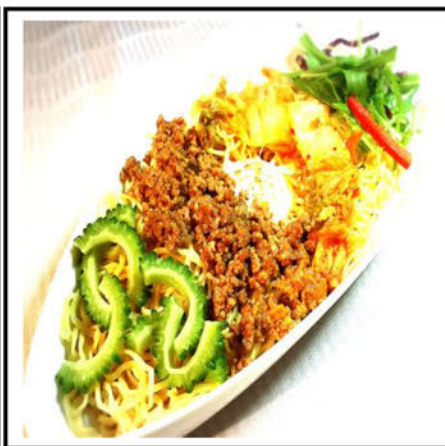
スタミナたっぷり冷やし中華 ¥780