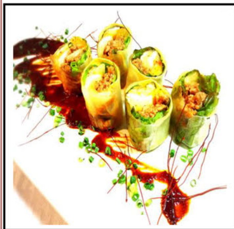
スパイシー生春巻 ¥630