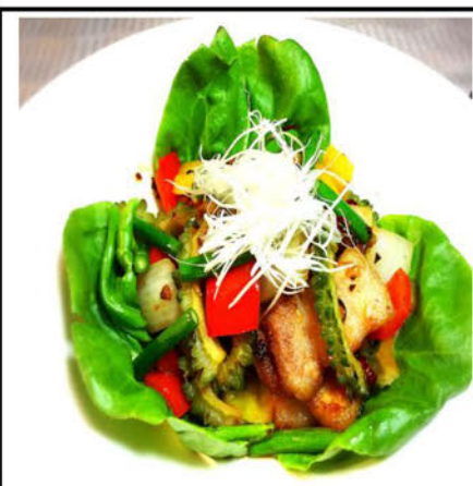
八雲豚のスタミナ炒め ¥850