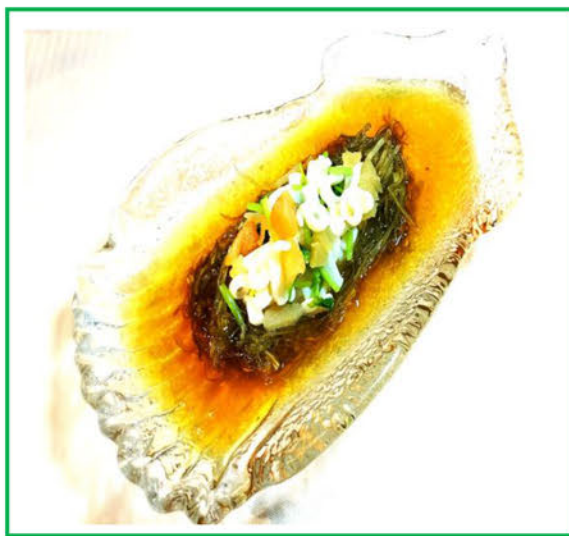
函館産イカと三つ葉の 冷製昆布ジュレ ¥600