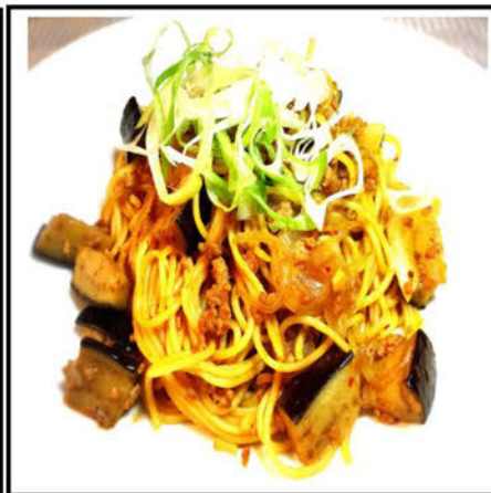
挽肉とナスのピリ辛パスタ ¥930