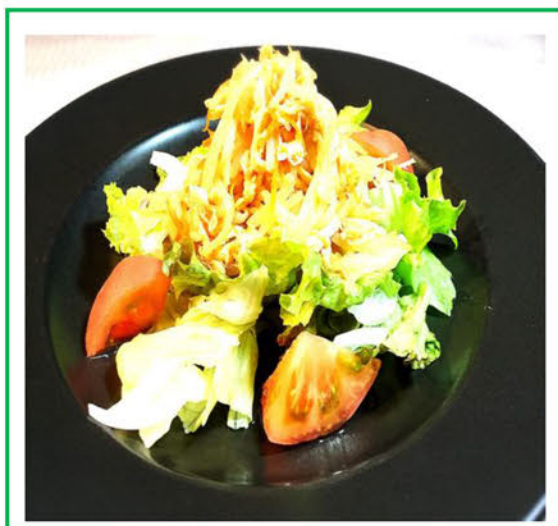
若鶏肉ともやし の中華風サラダ ¥600