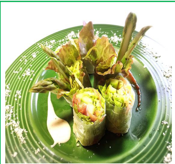
アスパラの生春巻き ¥750