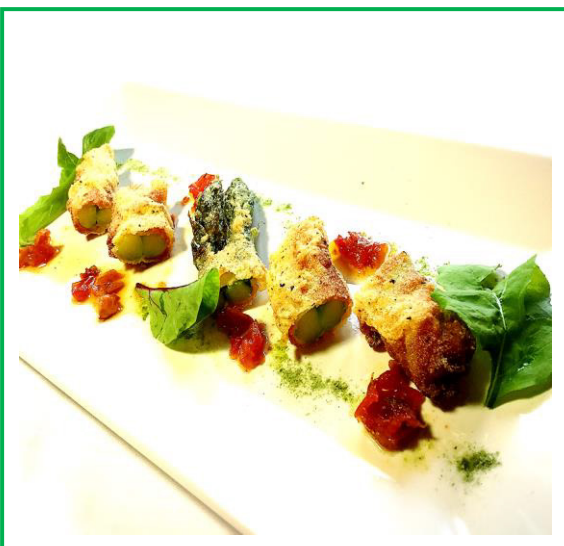
アスパラのパンチエッタ巻き セモリナ粉揚げ ¥680