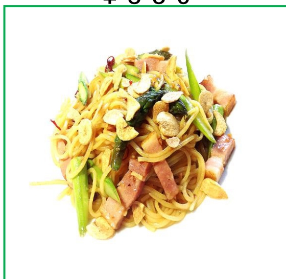
アスパラとベーコンのパスタ ¥1000