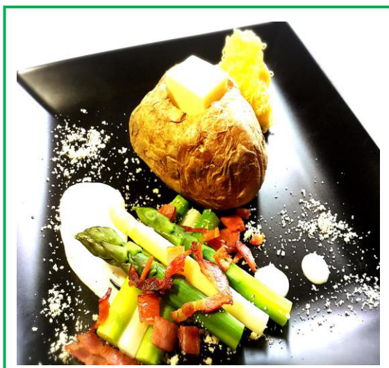
茹でアスパラとベーコンの 燻製バター 道産子盛り! ¥830