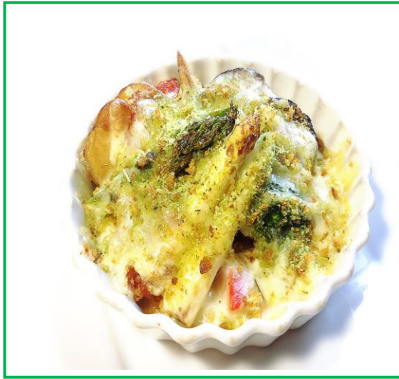
アスパラと野菜のグリル チーズパン粉焼き ¥850