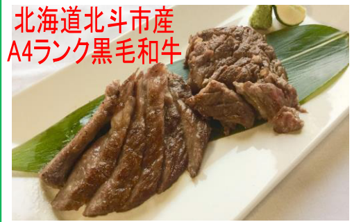
北海道北斗市産 A4ランク黒毛和牛 北斗黒毛和牛のステーキ 和風仕立て(160g) ¥2700