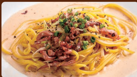
函館名物 塩辛パスタ Famous Hakodate pasta with Salted Squid