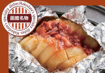
男爵芋と塩辛の波止場焼き Potatoes and pickled Squid in salt, Grilled in foil