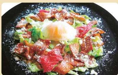
カリカリベーコンのサラダ 温泉玉子添え

Salad of Crisped Bacon with Poached Egg ¥830 (税込¥913)