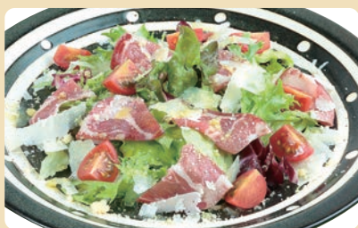
ハムとイタリアンチーズのサラダ Ham and Italian cheese salad

Salad of Crisped Bacon with Poached Egg ¥830 (税込¥913)