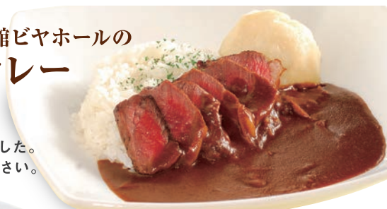
道産牛のステーキケレー じゃがいも添え Curry with Hokkaido beef steak, served with potatoes ¥1,050 (税込¥1,155)

明治13年頃、函館市民は カレーをケレーと呼んでいました。 オリジナルの味をお楽しみ下さい。