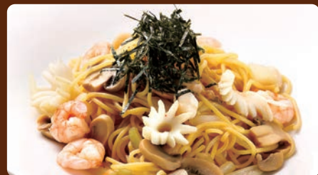
和風シーフードパスタ Japanese-style seafood pasta