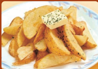
フライドポテト塩バター Fried potatoes