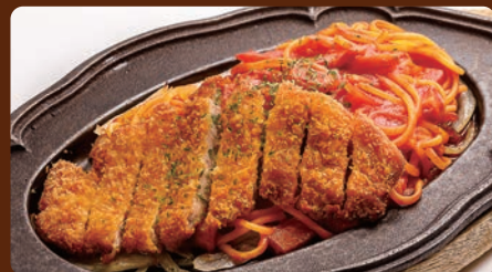
スパカツ ナポリタン(八雲豚ロース使用) Ketchup-based spaghetti Topped with a Deep-Fried Pork Cutlet (Made with Yakumo Pork)