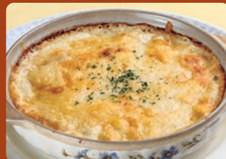
道産ジャーマンポテトのグラタン Gratin with bacon, onion and potatoes from Hokkaido