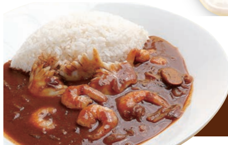
海鮮たっぷりシーフードケレー Seafood Curry ¥1,000 (税込¥1,100)