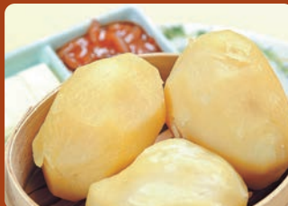
男爵いもの塩煮(バター、塩辛添え) Salt-boiled potatoes with butter and pickled cuttlefish